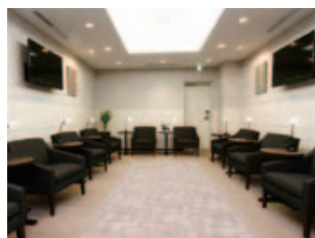
結果説明待合室(1階)