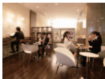
受診者専用ラウンジ(1階)