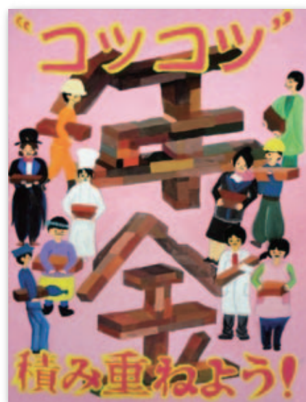
山形県年金ポスターコンクールより